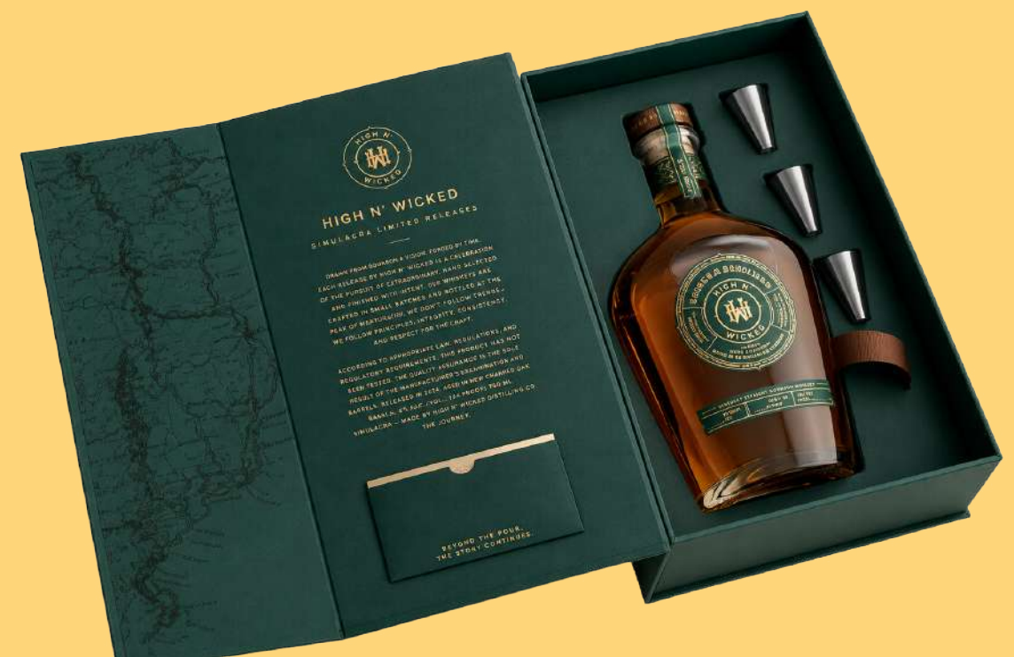
CAJA DE COLECCIÓN

Diseñamos empaques personalizados según las dimensiones, forma y necesidades de tu producto. Seleccionamos los materiales adecuados para garantizar protección, funcionalidad y una presentación que refuerce la identidad de tu marca.