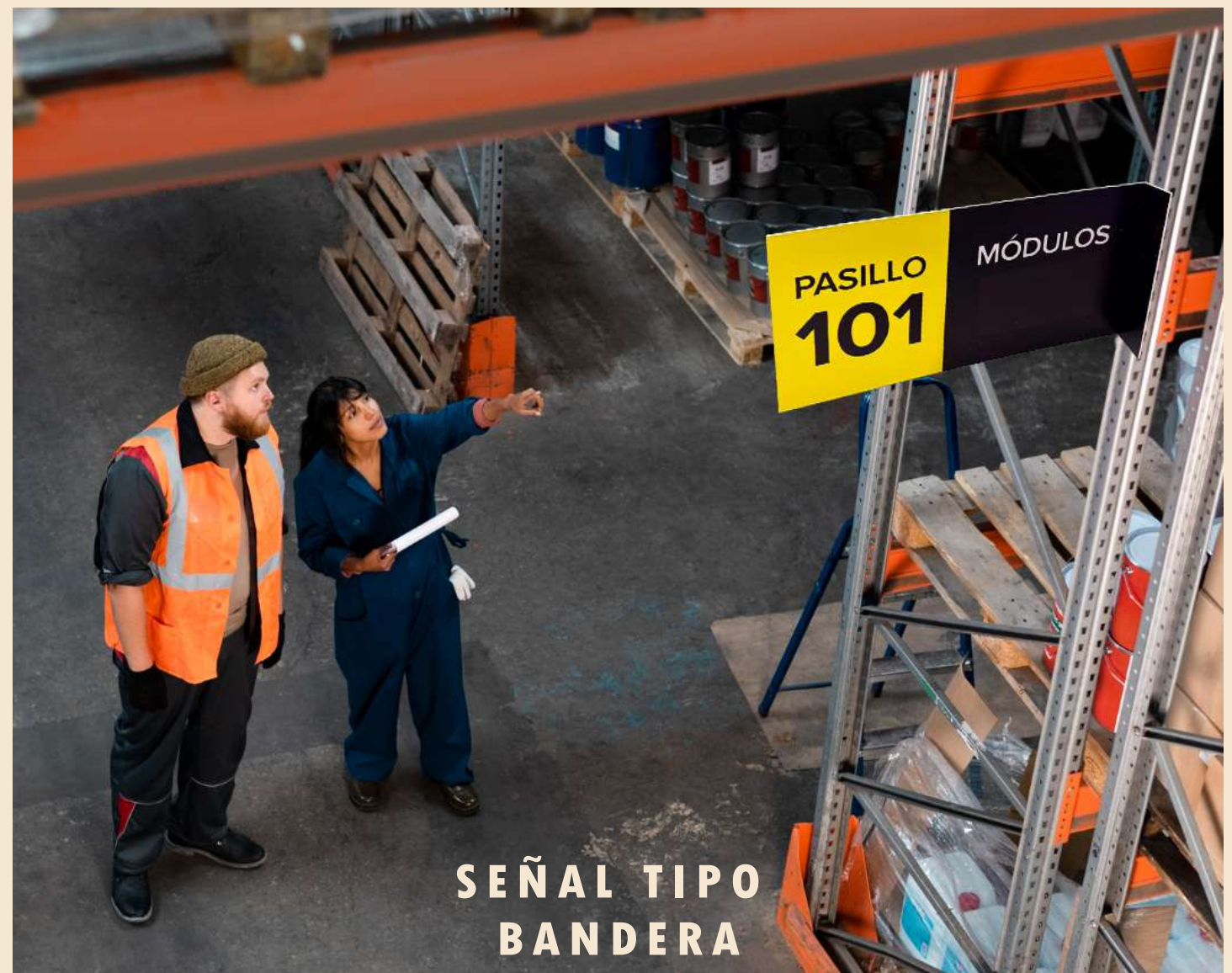
SEÑAL TIPO BANDERA

Una señalética efectiva va más allá de identificar espacios; es una herramienta estratégica que optimiza la operación diaria. Cuando se integra con los flujos de trabajo, la cadena de suministro y los procesos de mejora continua, facilita la ubicación rápida de materiales, productos y áreas de trabajo, reduciendo tiempos de búsqueda, errores y reprocesos. Diseñamos sistemas de identificación visual claros, accesibles y alineados con la operación de tu CEDIS, almacén o centro de distribución para mejorar la eficiencia y productividad en cada etapa del proceso.