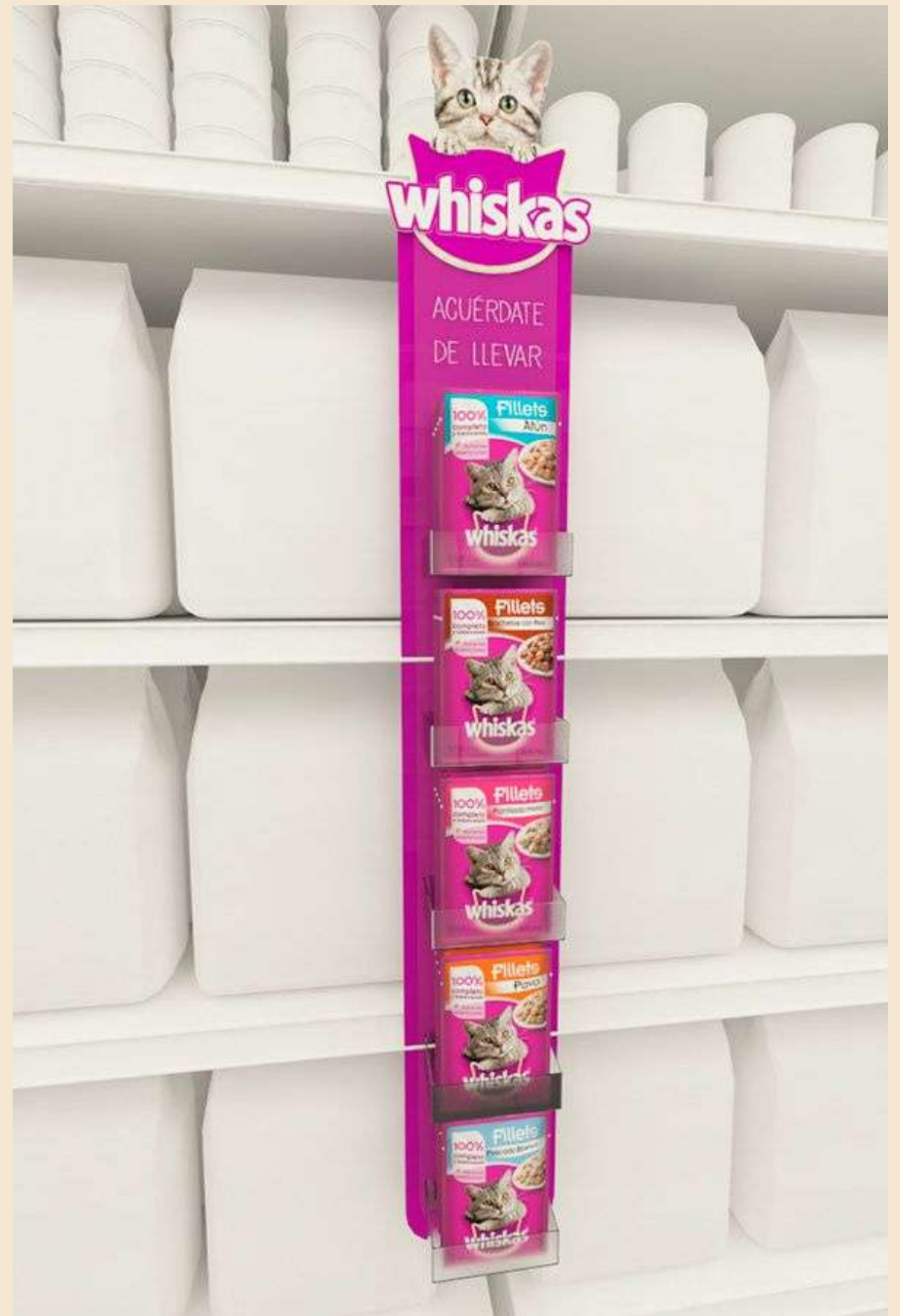
TIRA DE IMPULSO