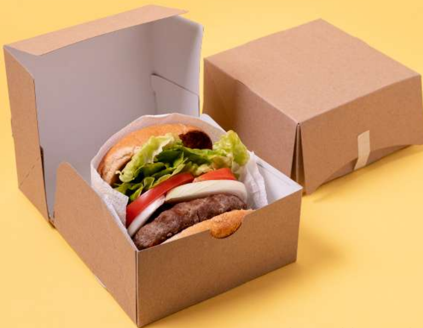
CAJA CON PEGUES