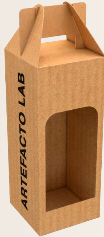
CAJA PARA VINO