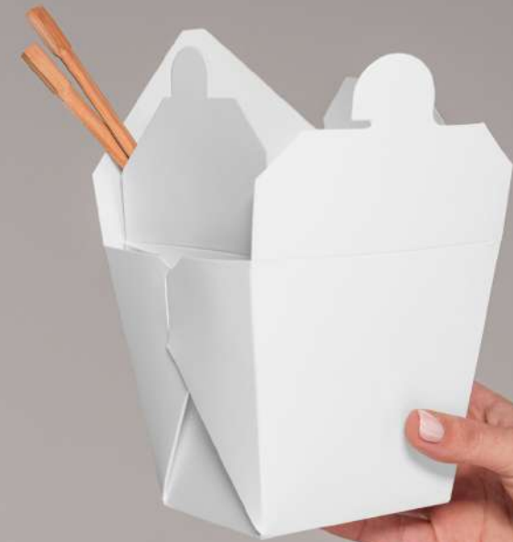
CAJA PARA SUSHI